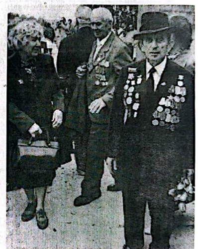
Ветераны II-й мировой...