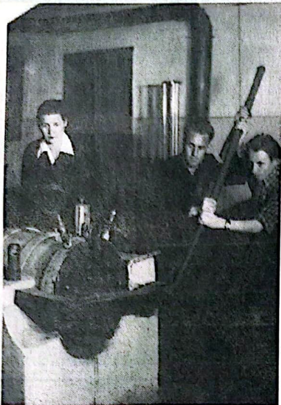
ГРЯНУЛА ВОЙНА. В июне 1941 года политехнический институт был закрыт. Многие преподаватели и студенты ушли на фронт, большая часть была направлена на работу, в основном, на оборонные предприятия. В зданиях института разместились общежития эвакуированных из Москвы предприятий.

В феврале 1942 года институт возобновил работу. Занятия велась в помещении школы № 6, с 19 до 24 часов вечера, то есть в третью смену, в здании механического факультета; ректорат располагался в физическом корпусе. Постепенно учебные корпуса были освобождены и возвращены институту. Все лаборатории и кабинеты были восстановлены руками преподавателей и студентов.